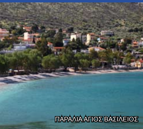
ΠΑΡΑΛΙΑ ΑΓΙΟΣ ΒΑΣΙΛΕΙΟΣ

Στα βουνά του Δήμου περιλαμβάνονται ο Ελικώνας, όπου σύχναζαν σύμφωνα με την παράδοση οι 9 Μούσες, ο Κιθαιρώνας και το Ύπατο (Πτώσ όρος) στην κορυφή του οποίου θα σας εντυπωσιάσει τόσο η Ι.Μ. Σαγματά όσο και η θέα από ψηλά. Αξίζει και ένας περίπατος στο καταπράσινο Δάσος του Μοσχοποδίου που διαθέτει αξιοσημείωτο βοτανικό πλούτο. Εκεί βρίσκεται το θέατρο «Μελίνα Μερκούρη» χτισμένο κατά τα πρότυπα αρχαίων θεάτρων και το γραφικό Ξωκλήσι