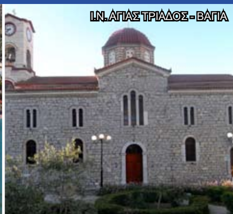
Ι.Ν. ΑΓΙΑΣ ΤΡΙΑΔΟΣ - ΒΑΓΙΑ